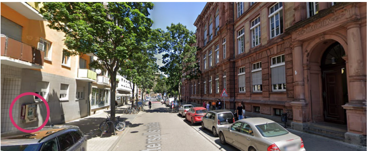
Abbildung 1 Zigarettenautomat gegenüber einem Schuleingang in Mannheim. Screenshot von Google Street View.

In Heidelberg haben 30 Prozent der Bildungseinrichtungen einen Zigarettenautomaten im Umkreis von 100 Metern und in Mannheim trifft dies auf 43 Prozent der Bildungseinrichtungen zu. Dies bedeutet, dass viele Kinder auf dem Weg zur Schule oder zur Kita mit Zigarettenautomaten konfrontiert sind (Abbildung 2). Dadurch gehören für Minderjährige Zigaretten zum normalen Straßenbild. Infolgedessen nehmen die Kinder und Jugendlichen Zigaretten – und damit das Rauchen – als etwas ganz Normales und Selbstverständliches wahr.