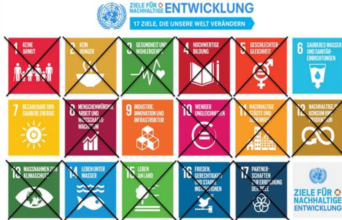
Die 17 UNO-Ziele für eine nachhaltige Entwicklung.