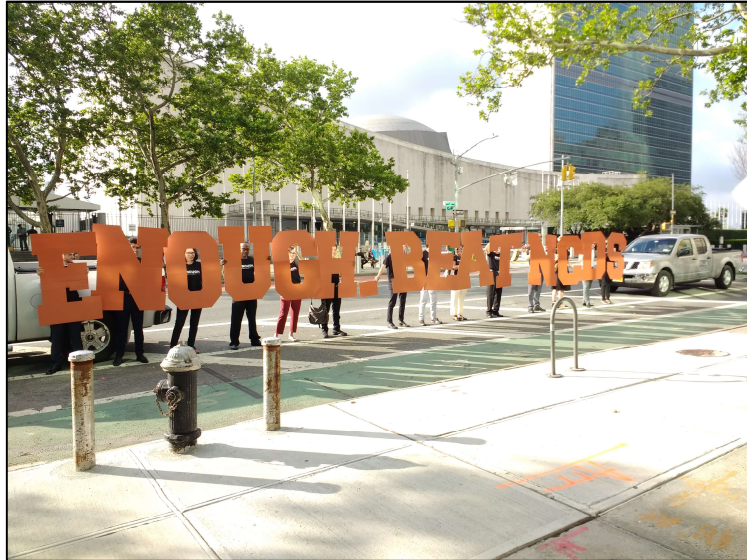
DANK beim UN Gipfel 2018 in New York