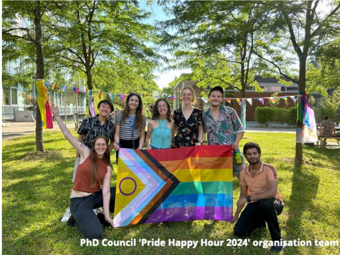
PhD Council 'Pride Happy Hour 2024' organisation team