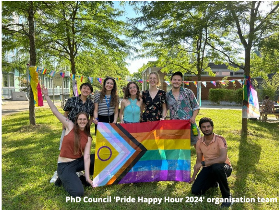
PhD Council 'Pride Happy Hour 2024' organisation team