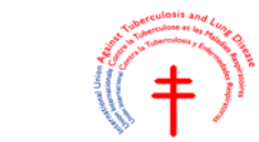
Internationale Union gegen Tuberkulose und Lungenkrankheiten