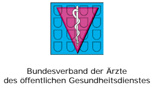
Bundesverband der Ärzte des öffentlichen Gesundheitsdienstes