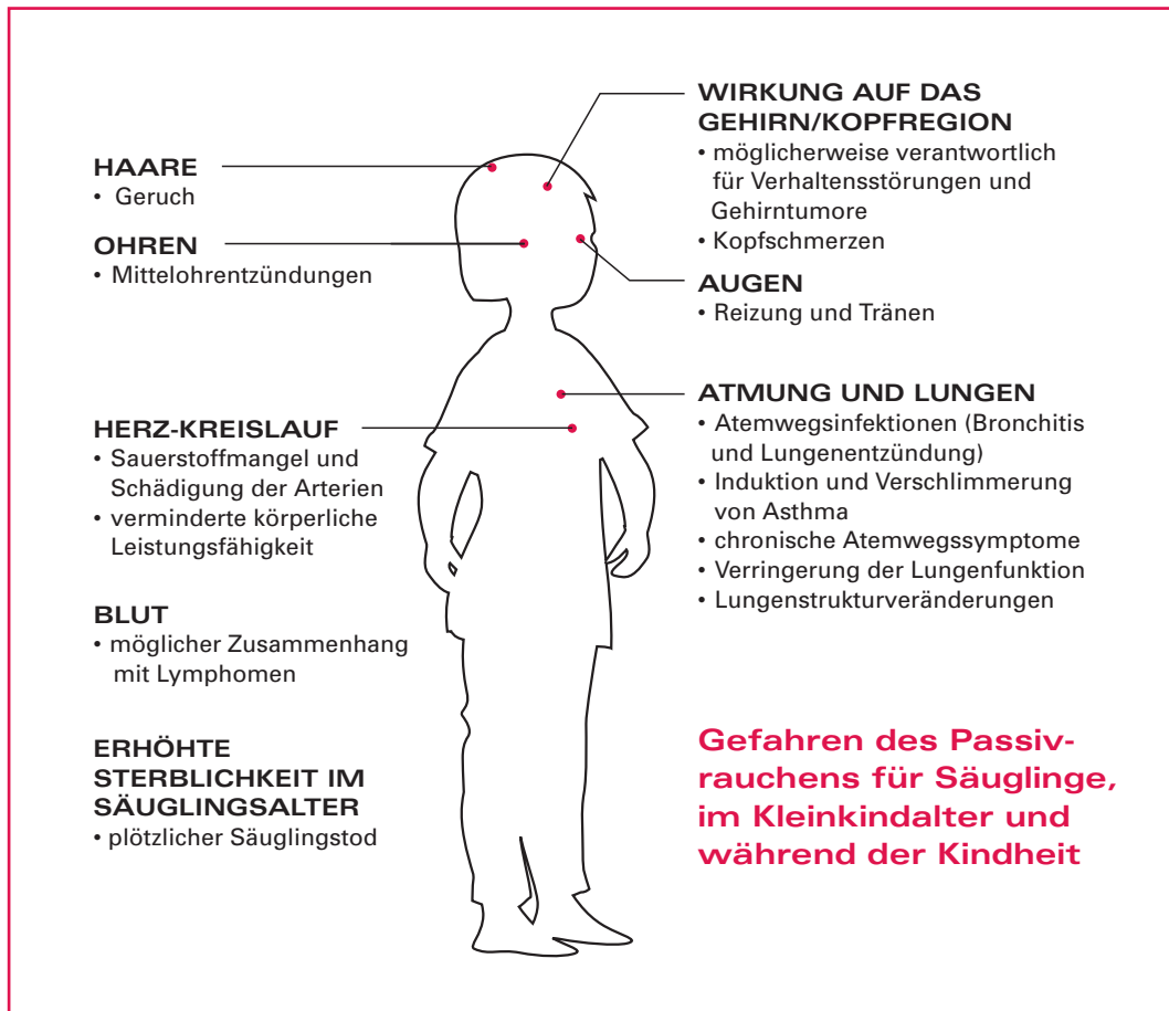
Abbildung 5 Gefahren des Passivrauchens für Säuglinge, im Kleinkindalter und während der Kindheit.