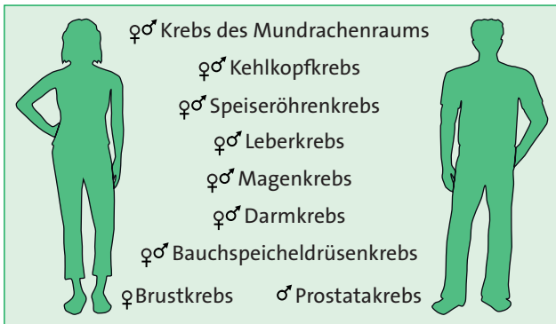
Abbildung 2: Alkoholkonsum steigert das Risiko für verschiedene Krebsarten. Darstellung: Deutsches Krebsforschungszentrum, Stabsstelle Krebsprävention, 2014

Weibliche Brust: Mit zunehmendem Alkoholkonsum steigt das Brustkrebsrisiko bei Frauen 6,13,31,36,41,44 . Selbst ein moderater Alkoholkonsum von einem alkoholischen Getränk (z.B. 0,3 Liter Bier) pro Tag erhöht das Risiko 31,41 . Pro zehn Gramm Alkohol (etwa 0,3 Liter Bier) nimmt das Risiko um etwa sieben Prozent zu 20 . Das Brustkrebsrisiko steigt vermutlich, weil Alkohol die Menge des weiblichen Hormons Östrogen erhöht; Östrogen wiederum fördert Brustkrebs 41,44 . Besonders Frauen mit einem erhöhten Brustkrebsrisiko (z.B. durch genetische Veranlagung) sollten Alkohol deshalb nur gelegentlich oder gar nicht trinken 41 .