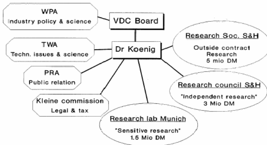
Abbildung 1: Struktur des Verbandes (im Jahr 1990). Der Wissenschaftspolitische Ausschuss (WPA) sowie der PR-Ausschuss (PRA) sind die beiden Ausschüsse, die sich mit Öffentlichkeitsarbeit und PR befassen. Der Technisch-wissenschaftliche Ausschuss (TWA) befasst sich mit technischen und wissenschaftlichen Problemen, die die Zigarettenindustrie angehen. Die “Kleine Kommission” befasst sich mit juristischen Belangen sowie mit Steuerfragen 5 .